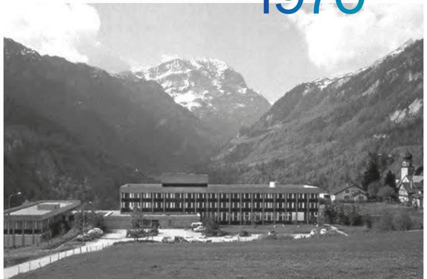
Das Rheuma- und Rehabilitations- zentrum Valens um 1970