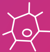
Internistisch- onkologische Rehabilitation