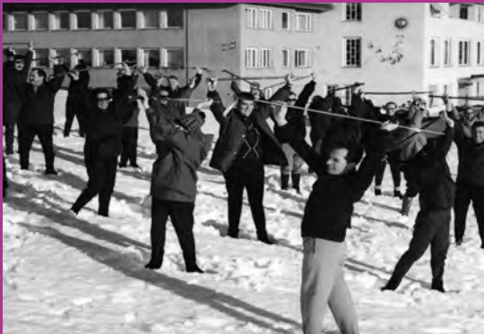
Morgenturnen vor der Klinik Gais

Die Rehaklinik Gais hat seit mehr als 65 Jahren Bestand. Alles begann 1956 mit der Idee einer «Klimastation für medizinische Rehabilitation in Gais». Und schon 1959 startete man dieses Vorhaben im Haus Blume am Dorfplatz Gais mit 20 Patientinnen und Patienten. Damit nahm die Erfolgsgeschichte der Rehaklinik Gais ihren Anfang.