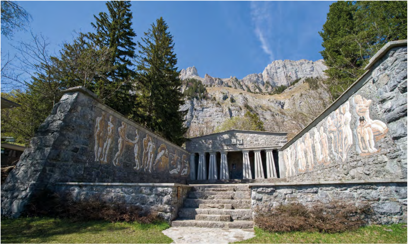
Das Paxmal (Friedensmal) am Walenstadtberg.

Karl Bickel war ein Schweizer Maler, Bildhauer, Briefmarkensteher und Grafiker. 1913 – mit 27 Jahren – erkrankte er an Tuberkulose. Er musste für 13 Monate zur Kur in das Lungensanatorium Walenstadtberg. Die Krankheit war bereits stark fortgeschritten, sodass kaum noch Aussicht auf Heilung bestand. Darauf gelobte er, sein Leben sinnvoll zu gestalten, wenn er davonkommen sollte. Während dieser schweren und langen Zeit der Ungewissheit entstand die Grundidee eines monumentalen Werks. Nach seiner Genesung kehrte er nach Zürich zurück und wurde aufgrund seiner Plakatarbeiten einer breiten Öffentlichkeit bekannt.