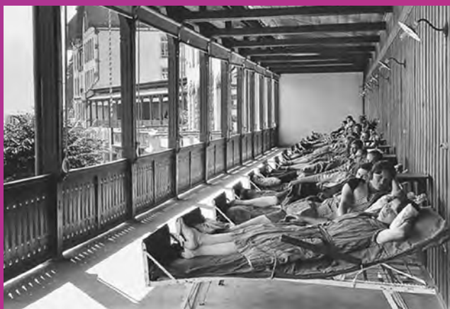
Einstige Liegekuren für Lungenpatienten – getrennte Terrassen für Männer und Frauen.

stiess die Rehaklinik Walenstadtberg zu den Kliniken Valens. Durch die Fusion mit den Zürcher RehaZentren im Jahr 2023 entstand daraus die Klinikgruppe Valens.